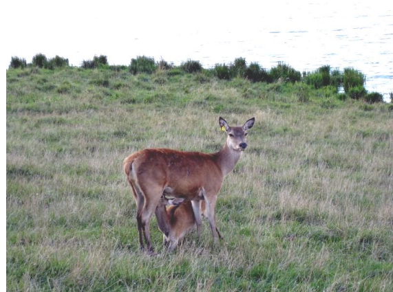
Fot. 2. Pora na śniadanie