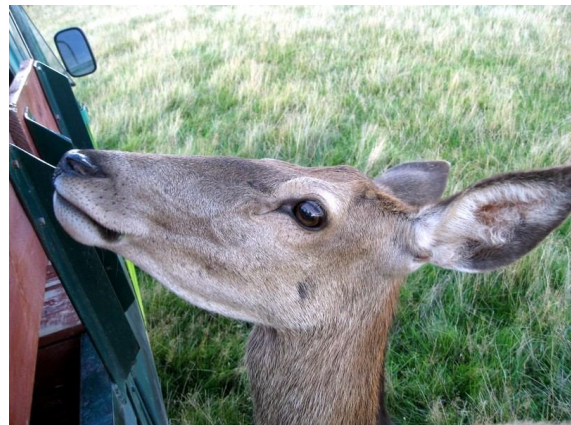
Fot. 4. Ciekawość zwycięża strach