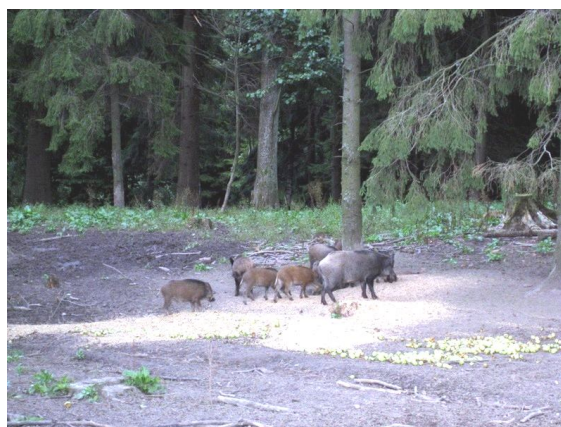
Fot. 8. Skąd tu tyle witamin?