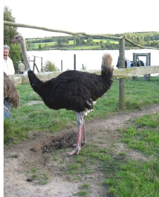
Fot. 12. Jestem wysoki i przystojny

Możliwość uczestnictwa w bezkrwawym safari nie jest jedyną atrakcją, jaką oferują właściciele. Znajdująca się na terenie obiektu jedna z wysp, stylizowana na wyspę Jaćwingów, jest miejscem urządzania pikników i biesiad. Wśród kulinarnych specjalności królują smażone i wędzone ryby, hodowane na miejscu (dorodne liny, okonie, sumy, karpie goście mogą złowić sobie sami), pieczone dziki i ogólnie potrawy z dziczyzny. Atrakcją jest jajecznica z jaja strusiego, smażona na oczach gości w ognisku. Takie same kulinarne smakowitości