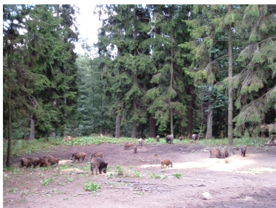
Fot. 7. Pełny żołądek to jest to!