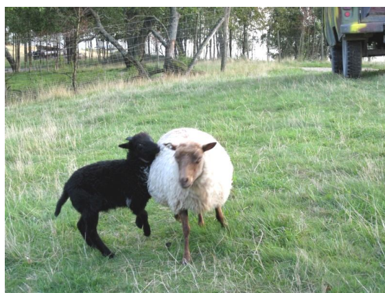
Fot. 10. Mama jest najważniejsza