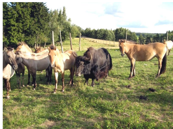
Fot. 6. Zgodna współzystencja