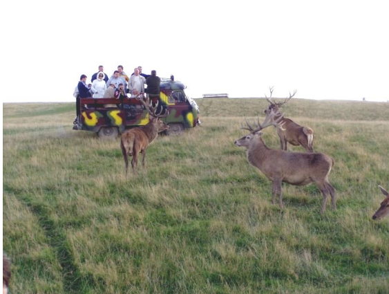
Fot. 3. Pokojowy podział przestrzeni