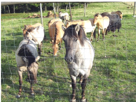
Fot. 5. Nowa rasa koni, jeszcze bez nazwy