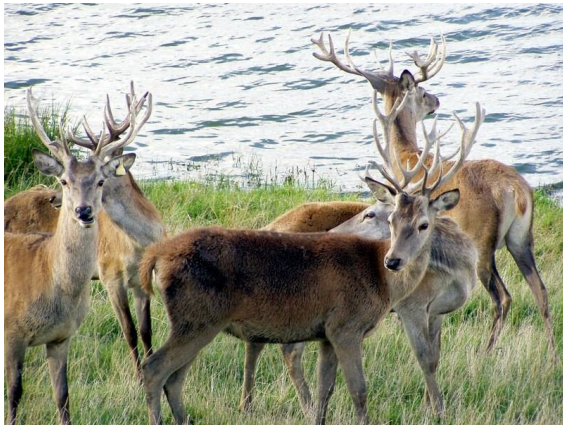
Fot. 1. Jelenie na rykowisku (wrzesień 2009)

niemal identycznych jak na wolności. W tym okresie park udostępniany jest do zwiedzania. Większość zwierząt, mimo że są z natury dzikie, nie odczuwa zbytnio lęku przed ludźmi, stąd wizyta dostarcza niezapomnianych wrażeń. Gospodarzowi udało się nawet z kilkoma osobnikami zaprzyjaźnić. W okresie zimowym stada żyjące w naszym klimacie na wolnym powietrzu (jeleniowate, dziki) przepędzane są do mniejszych kwater, gdzie są dokarmiane i poddawane niezbędnym zabiegom weterynaryjnym. Zwierzęta bardziej ciepłolubne (wielbłąd, zebry, kangury i konie) zimują w oborze. Podobnie pod dachem spędzają zimę strusie i ptactwo ozdobne.