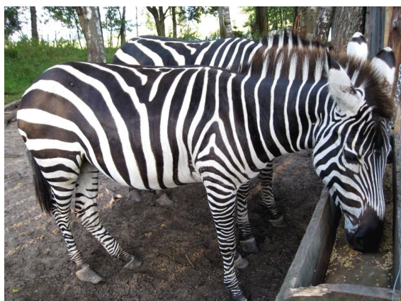
Fot. 11. Zawsze modnie ubrane